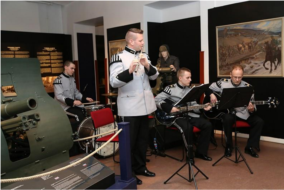
Avajaisissa esiintyivät Panssarisoittajat esittäen Jääkärien marssin ja Sillanpään marssilaulun.